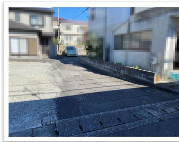
↑ 路地状敷地部分 ↑