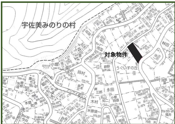
* 図面と現況が異なる場合は現況を優先します